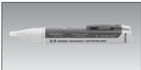
Fluke 1 AC VoltAlert